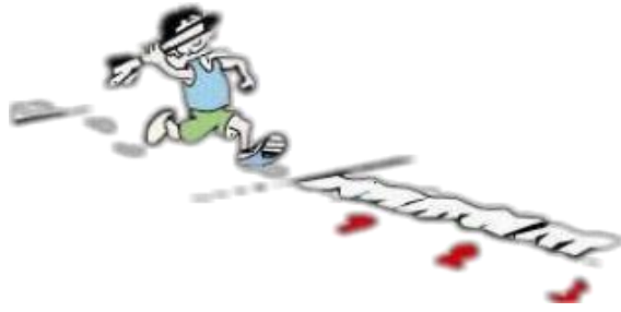
投掷软式标枪场地示意图