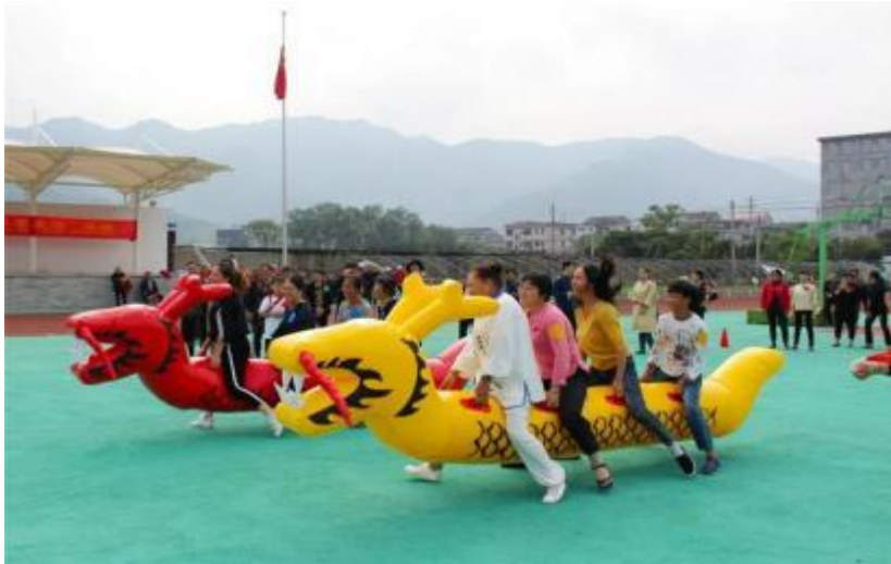
旱地龙舟场地示意图